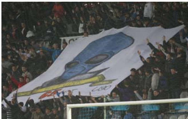
30 СЕНТЯБРЯ. РАМЕНСКОЕ. «САТУРН-2» - «ЛОКОМОТИВ-2» - 0:2. БОЛЕЛЬЩИКИ «САТУРНА».