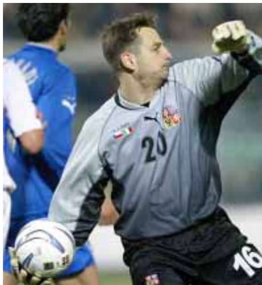
В товарищеском матче против сборной Италии.