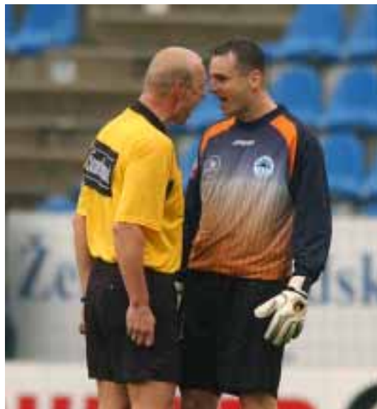
Судья не всегда прав...