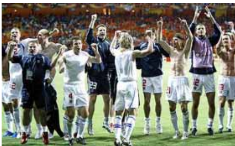
Еуро-2004. Радость победы над Голландией.

на клубном автобусе ехали из Раменского до спартаковского манежа три с половиной часа. А ведь это всего 40 километров! В Праге заторы на дорогах тоже есть, но это был настоящий кошмар.