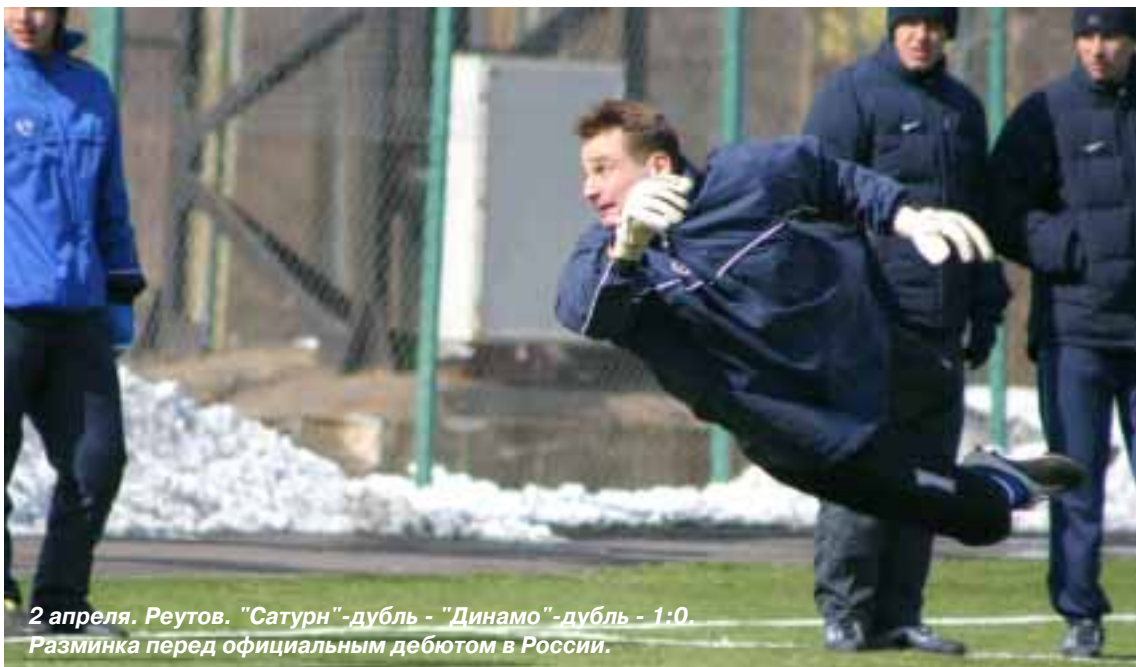
2 апреля. Реутов. "Сатурн"-дубль - "Динамо"-дубль - 1:0. Разминка перед официальным дебютом в России.

- Не видел игры с «Амкарм», но мне уже рассказали, что сыграли неудачно. Тем более, гости два раза ударили по воротам и завоевали очко. Нам же, дабы попасть в лидирующую группу, необходимо побеждать и дома, и в гостях.