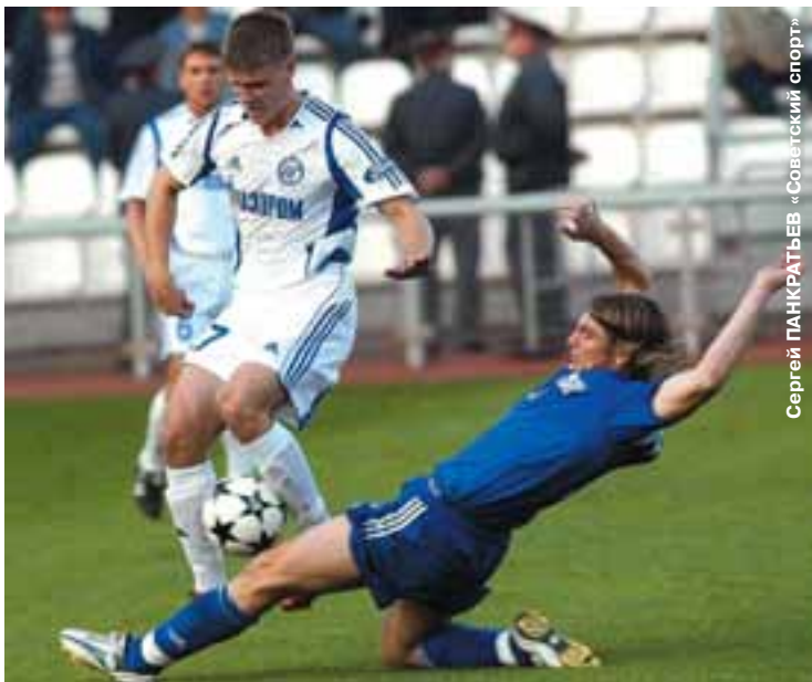
Сергей ПАНКРАТЬЕВ «Советский спорт»

- Так сам «Зенит» в последние сезоны мало кому проигрывает. Это сильный и сбалансированный коллектив. С приходом Ад-