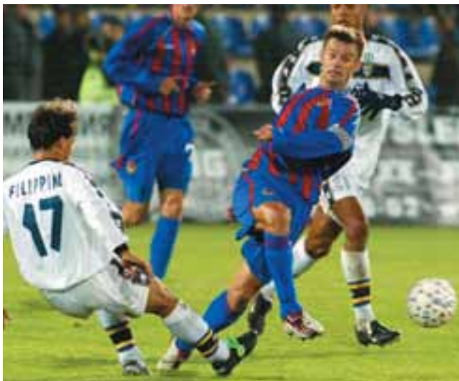
19 сентября 2002 года. Раменское. Стадион «Сатурн». Кубок УЕФА. ЦСКА - «Парма» Италия - 1:1. Второй еврокубковый матч на подмосковном стадионе.