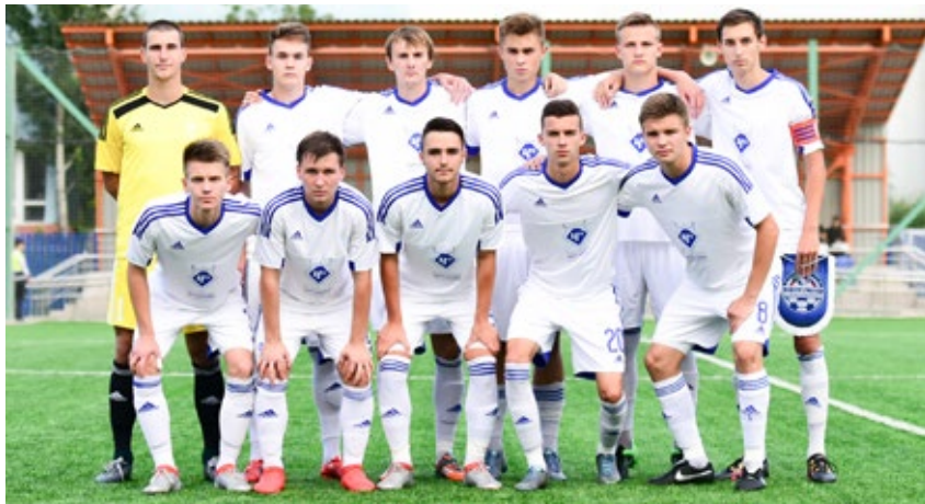
«Чертаново» перед матчем с «Энергомашем».