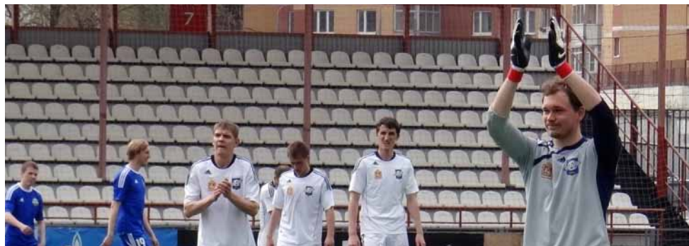
25 апреля. Химки. «Истра» - «Сатурн» - 2:1. Футболисты благодарят болельщиков за поддержку.

Из других событий отметим тот факт, что «Шексна» воспользовалась осечками раменской команды и вышла на десятое место. Подтянулась к «Сатурну» и «Карелия». Но главное событие произошло в лидирующей группе. Костромской «Спартак», взяв в двух турах лишь очко и проиграв очный матч «Петротресту», пропустил «строителей» на первое место. А «Текстильщик» теперь второй. Наверху весной будет жарко, нам же просто хочется видеть достойную игру любимой команды. Она не решает больших задач, но остаётся честной перед собственным болельщиком.