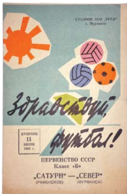
Программа к матчу «Север» - «Сатурн», который состоялся в Мурманске в 1968 году.

В прошлом сезоне в первенстве зоны «Запад» «Север» финишировал на достаточно высоком 6 месте. И это при том, что часть турнира мурманчане принимали соперников не в родном городе, а в Санкт-Петербурге. Нынешний статус одного из аутсайдеров обманывать не должен: легких игр во втором дивизионе ждать не приходится.