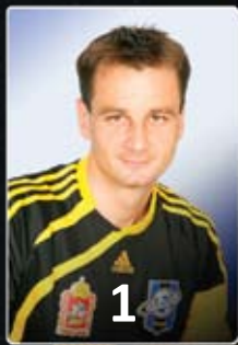
Кински Антонин Амплуа: вратарь Гражданство: Чехия Дата рождения: 31.05.1975 Рост - 187 см, вес - 86 кг