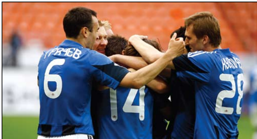
5 мая. Москва. «Локомотив» - «Сатурн» - 0:1. Черно-синие празднуют первую победу в сезоне.