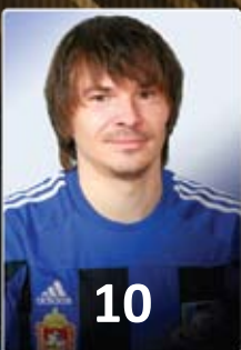
Лоськов Дмитрий Амплуа: полузащитник Гражданство: Россия Дата рождения: 12.02.1974 Рост - 178 см, вес - 80 кг