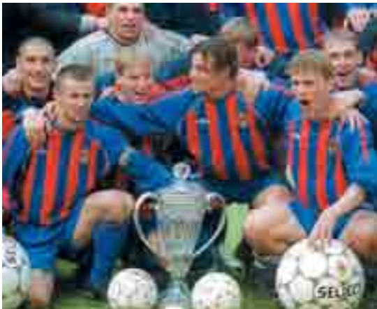
ЦСКА - обладатель Кубка России-2001/02.

Голы: Р.Гусев, 30 (1:0). Д.Коваленко, 59 (1:1). Д.Кириченко, 82 (2:1). И.Ярошик, 90 (3:1).