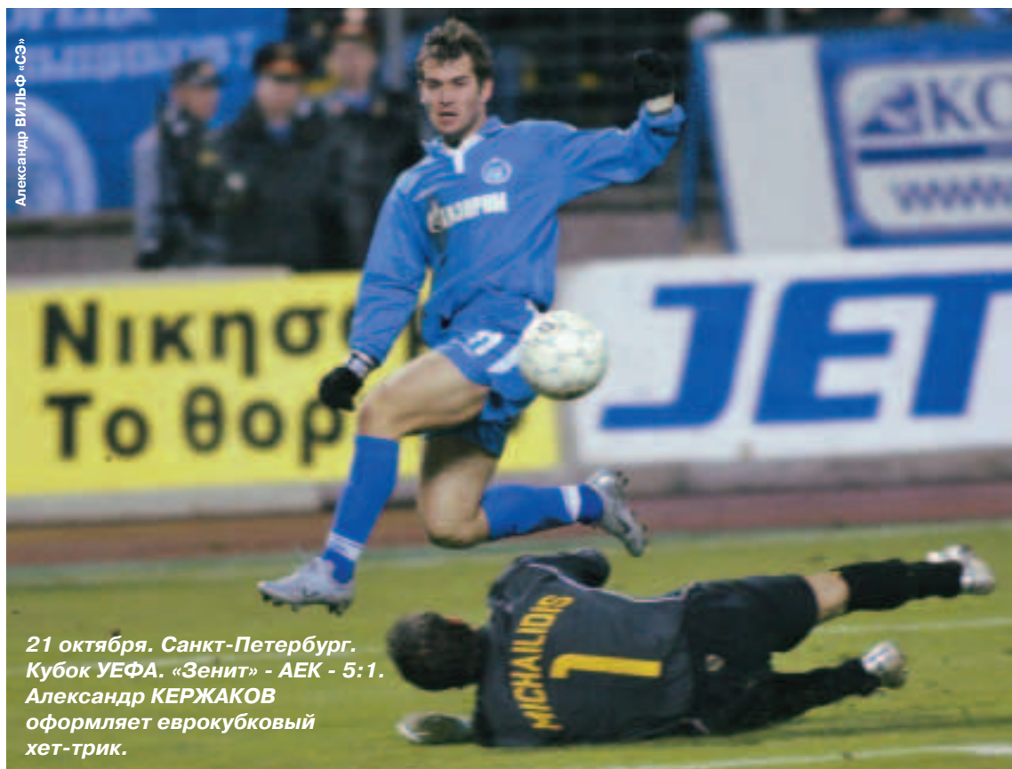
21 октября. Санкт-Петербург. Кубок УЕФА. «Зенит» - АЕК - 5:1. Александр КЕРЖАКОВ оформляет еврокубковый хет-трик.