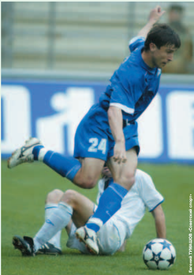
Евгений ТУМАШОВ «Советский спорт»