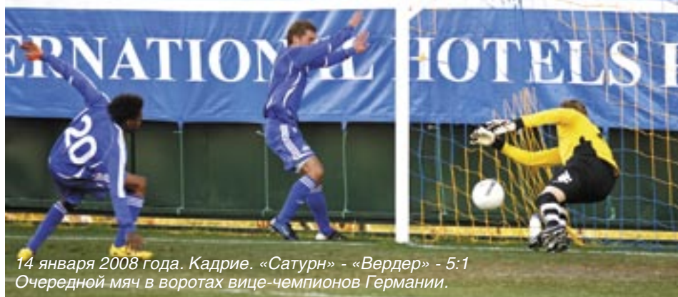
14 января 2008 года. Кадрие. «Сатурн» - «Вердер» - 5:1 Очередной мяч в воротах вице-чемпионов Германии.