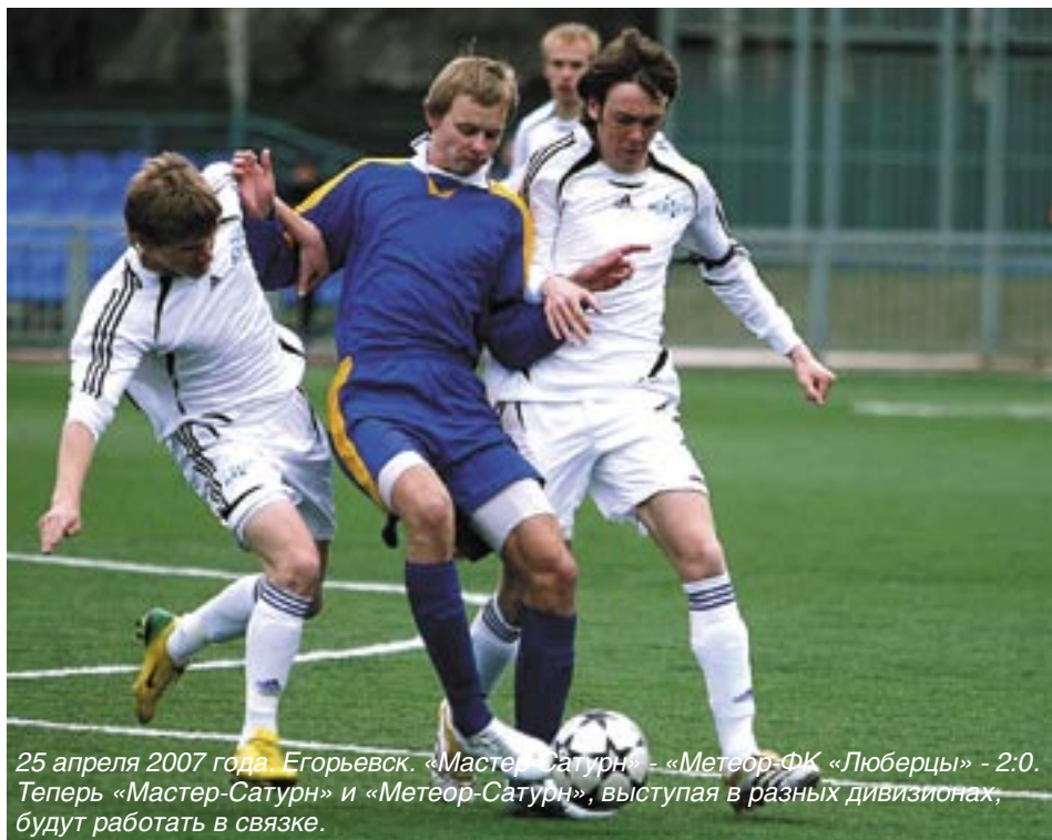
25 апреля 2007 года. Егорьевск. «Мастер-Сатурн» - «Метеор-ФК «Люберцы» - 2:0. Теперь «Мастер-Сатурн» и «Метеор-Сатурн», выступая в разных дивизионах, будут работать в связке.

Согласно регламенту в матчах любительского турнира могут выходить на